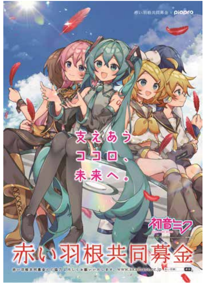
Art by さざなみ © Crypton Future Media, INC. www.piapro.net piapro